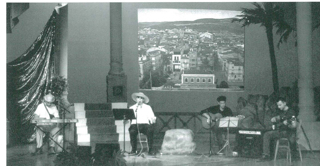
FESTIVAL D'AHIR I D'AVUI

Com tots els anys per aquest temps, estem en plenes Jornades de Teatre. Quan rebreu aquesta revista estaran acabant-se. En la pròxima us en farem una valoració, encara que la que val és la que en fa el públic i la que més tenim en compte.