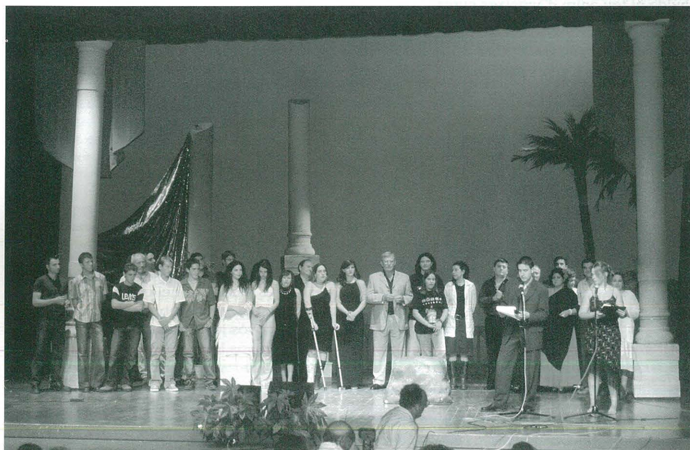
PARTICIPANTS AL FESTIVAL D'AHIR i D'AVUI